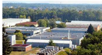
L'ancien Site MBDA Technoparc de Salbris

Grâce à ces nouveaux employeurs, que ce bulletin souhaite entre autres vous présenter,