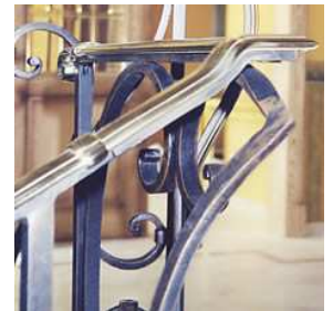
EURL DAMIEN MINIER

EURL Damien Minier Zone des Cousseaux Technoparc 41 300 Salbris 02.54.97.25.57